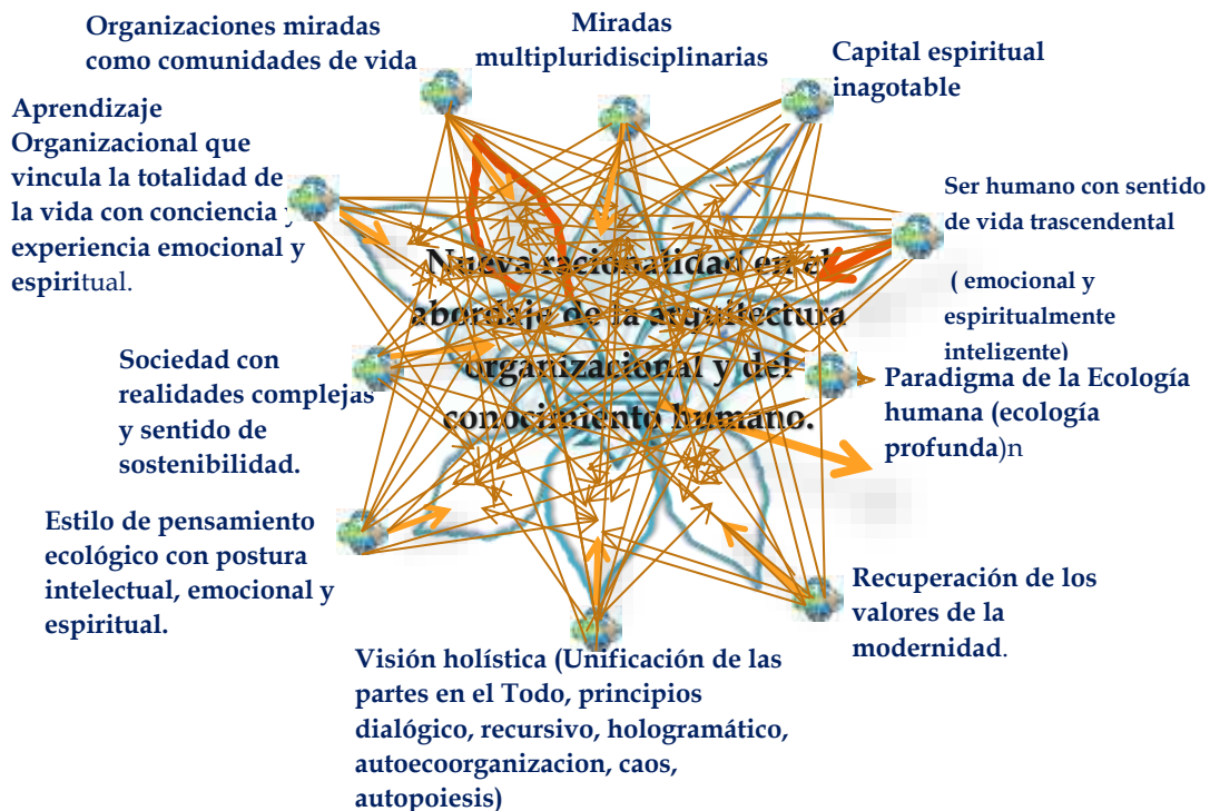
Figura 2. Simbolismo de la organización desde el Paradigma de la Ecología Humana con visión holística y estilo de pensamiento ecológico

Nuevas miradas, representaciones, pensamientos e intenciones, se transforman en los pétalos de ese lirio que florece, un nuevo orden paradigmático y pensamiento distinto, que se entrelazan en una imbricación cuántica, como lo plantea Mussa (ob.cit.,p.14), “la cognición cuántica se sustenta a su vez en el pensamiento complejo, la teoría del caos y el concepto de estructuras disipativas de Prigogine”, generando flujos de energía capaces de producir comunidades de vida, con miradas multipluridisciplinarias que invitan al gerente a reinventar(se) con creatividad, sentido de vida, y transcendencia hacia un cosmos mejor. Seguidamente en la figura 2 se representa el simbolismo de la organización con mirada desde el paradigma de la ecología humana con visión holística y estilo de pensamiento ecológico.