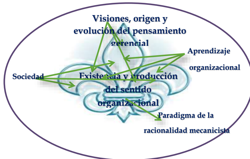
Figura 1: Organización con mirada Racionalista Tradicional.

Un primer pétalo representa las visiones, el origen y la evolución del pensamiento gerencial, otro pétalo el aprendizaje organizacional; el último pétalo representa a una sociedad que ha vivenciado y sentido el agotamiento del paradigma de la racionalidad mecanicista de la administración científica, que por mucho tiempo envolvió la presencia y producción del sentido organizacional, instituidos con perspectivas funcionalistas y estructuralistas, aproximado a un estilo de pensamiento racional, subestimando el emocional e ignorando el espiritual; y como lo pensaron Zohar y Marshall (2001, p.35), “en occidente la cultura racionalista, tradicional, con todas las razones y valores que la acompañaron empezaron a derrumbarse como resultado de la revolución científica y el auge del individualismo y el racionalismo”. Seguidamente se presenta en figura 1 el simbolismo de una organización con mirada racionalista tradicional.