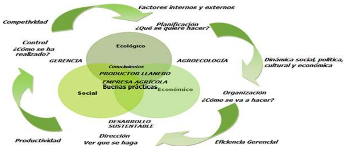
Figura N.º 1. Proceso administrativo de la empresa agrícola.