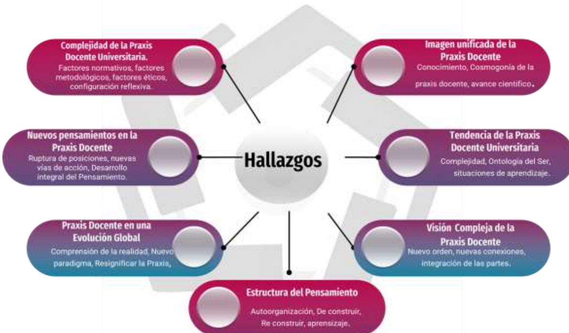
Gráfico N° 1 Holograma de los Hallazgos.