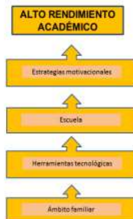
Figura N° 2: Proceso del acompañamiento familiar para el logro de los resultados

También, Camargo, (2021): destaca en el artículo científico: Estrategias pedagógicas ante la pandemia por COVID 19: una visión desde la interculturalidad, cuyo objetivo fundamental es transformar los espacios de inclusión educativa en contextos multiculturales, a través de estrategias pedagógicas artísticas, de la comunidad educativa en las instituciones educativas públicas e interculturales de Riohacha Distrito Cultural Turístico, a través de su participación en el proceso educativo haciendo especial énfasis en la integración cultural. La estrategia que pareció adecuada y más inmediata fue la reunión virtual utilizando los teléfonos inteligentes, por video llamadas con los colegas docentes para darles a conocer la problemática relativa al proyecto, y motivarlos hacia la participación.