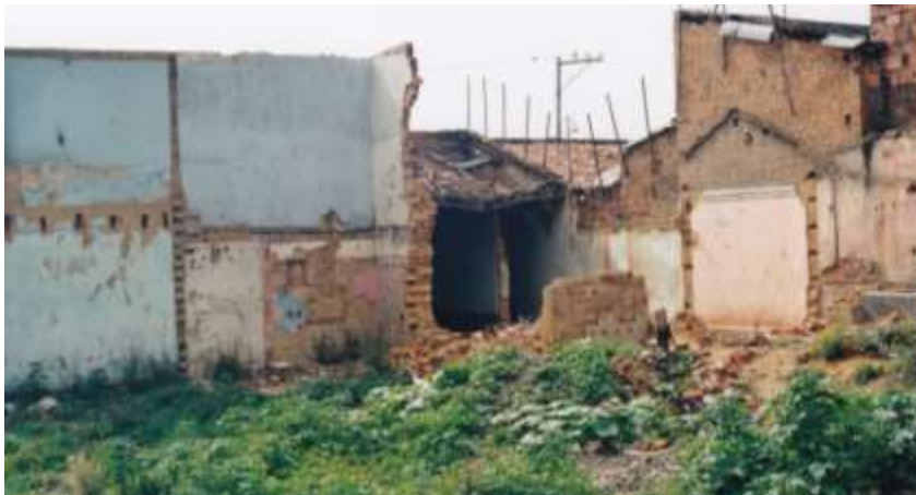
Imagen 5. La construcción requirió la demolición de una parte importante de los barrios Antigua Fábrica de Loza y Belén con las consecuentes afectaciones en el tejido social existente.