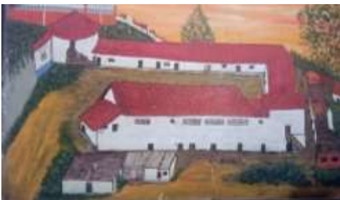
Imagen 1. Izq. Dibujo de la planta física original de la fábrica de loza. Der. Aerofotografía del actual barrio.

De acuerdo con Beltrán (2008), en el siglo XIX empieza el auge por la producción de materiales para construcción (ladrillos, tejas y tubería) así como en la elaboración de loza fina. Según Therrien (2007), la fábrica de loza fue fundada en 1832 con el finde satisfacer las necesidades locales, así como aprovechar la disponibilidad de las materias primas en el territorio local, sustituyendo la importación del viejo continente. La implantación de esta fábrica generó cambios en el paisaje urbano, ya que alrededor de la misma se construyó el conjunto de viviendas para los operarios de esta industria, así como se consolidaría el perfil obrero de la población que ocuparía los barrios que posteriormente irían apareciendo a los alrededores 3 . Esto incidió en la especialización de ese sector con una industria específica, a la vez que gracias a la dinamización de la economía pronto se convirtió en un centro poblacional y de comercio de relevancia para la Bogotá de la época.