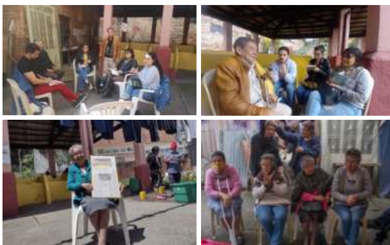
Imagen 6. Metodologías desarrolladas con la comunidad en las diferentes fases.