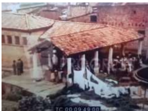
Imagen 4. Izq. Fotografía de los lavaderos comunitarios (año 1970 CA). Der. Aerofotografía del actual predio que ocupan los lavaderos comunitarios.