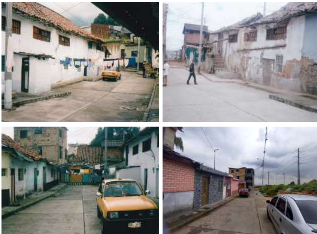
Imagen 3. Esta serie de fotografías presentan el deterioro y desaparición de parte de las edificaciones originales a causa de la falta de intervención y mantenimiento, así como la densificación y transformación paulatina de las viviendas.

esa fragmentación (...) en 1944, Alfredo Bateman, secretario de Obras Públicas (...) dispuso la diferencia de ‘zonas estrictamente residenciales’ de ‘zonas obreras’. El sur solo se definía como zona destinada para construcción de vivienda obrera” (Zambrano, 2007: 167).