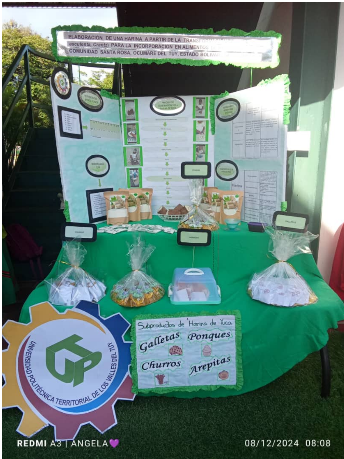
ANEXO 3. Exhibición de productos elaborados con recursos de autogestión por parte de los participantes de PDA, para el desarrollo de sus proyectos. Julio/2025