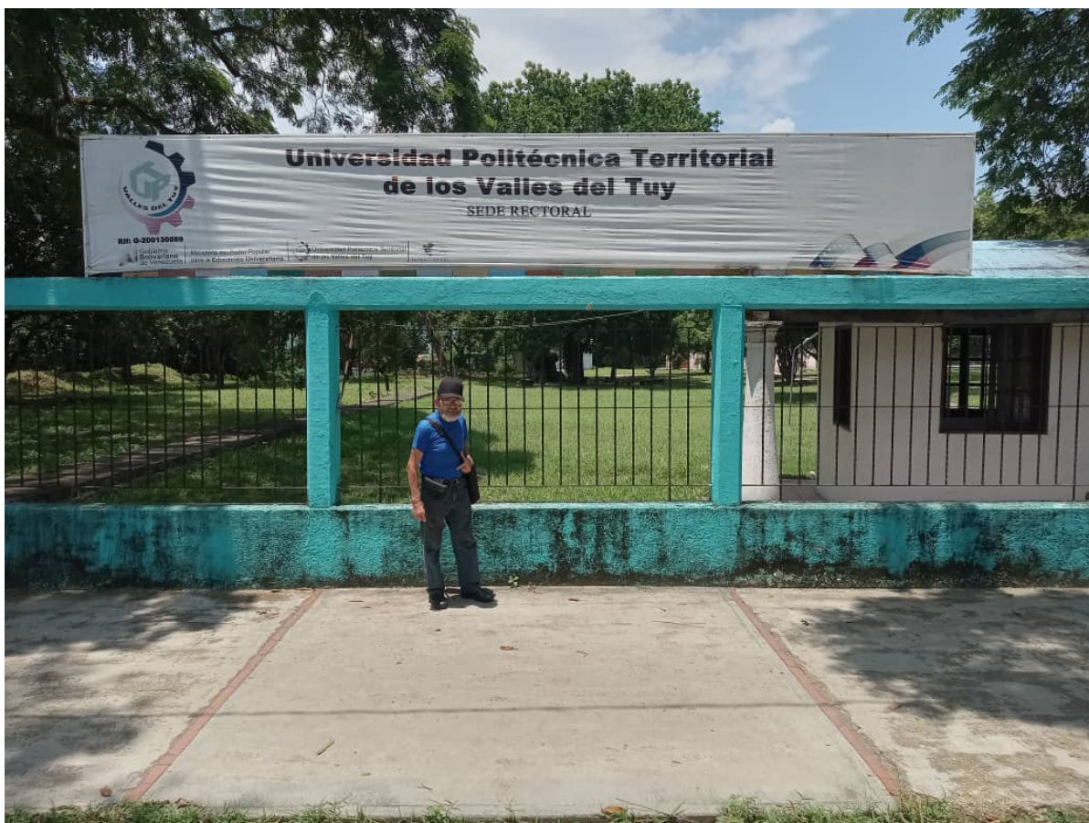
ANEXO 1. Visita a las instalaciones de la Sede en Ocumare del Tuy. Proceso de Recolección de Información. Julio/2025