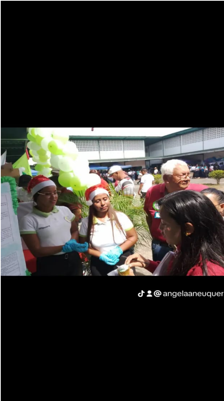
ANEXO 5. Visita a las instalaciones de la Sede en Ocumare del Tuy. Expo feria de proyectos productivos. Julio/2025.