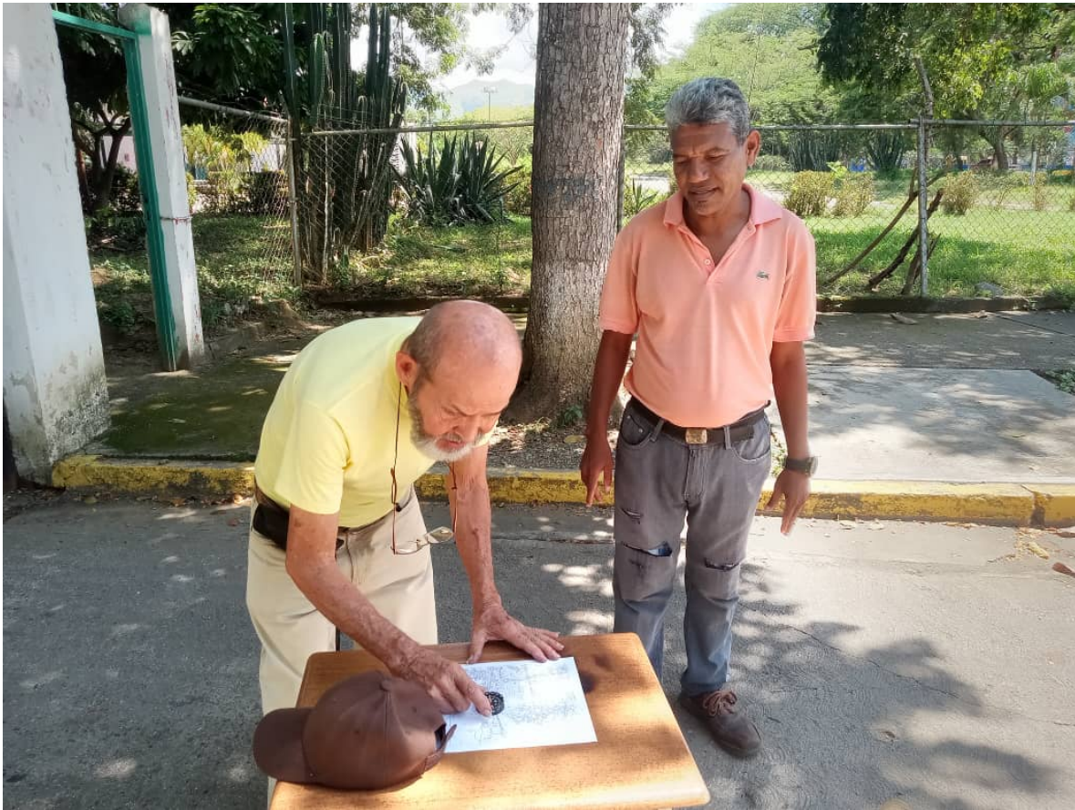
ANEXO 2. Verificación del Plano de ubicación de la Base Agrícola. Junio/2025